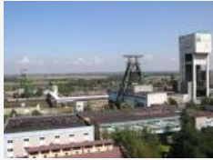
Kopalnia Zofiówka

Grupa Kopex, trzeci na świecie producent sprzętu dla górnictwa, złożyła jedyną ofertę budowy nowego szybu kopalni Zofiówka JSW - dowiedziała się „Rz”