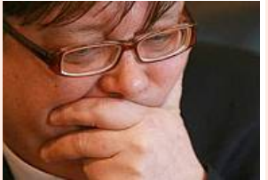
Prezes TVP straci stanowisko? (3)