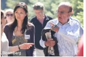
Magnat medialny dzieli swoje imperium