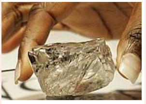
Diament-gigant poszedł za 18,4 mln USD (2)