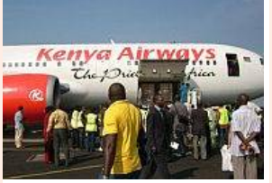
Kenya Airways oferują "taryfę Obamy" (4)